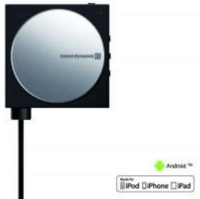
beyerdynamic A 200 p