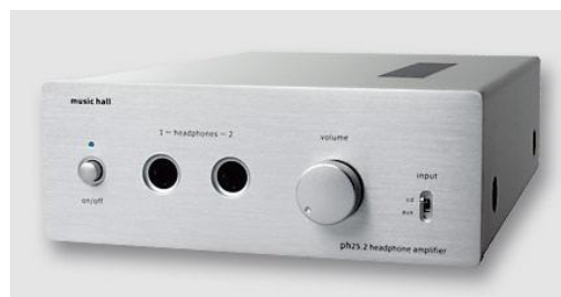
Music Hall ph25.2