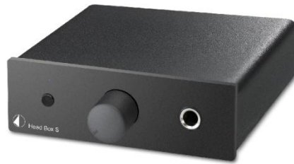
Pro-Ject Head Box S