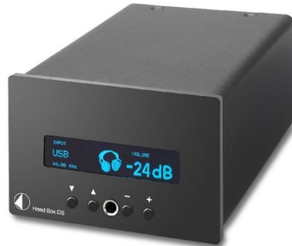
Pro-Ject Head Box DS