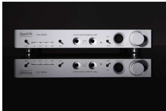
Questyle CMA 800 R